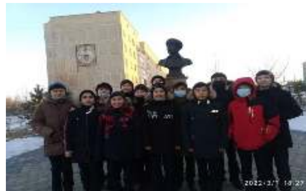
Ақан сері бюсті