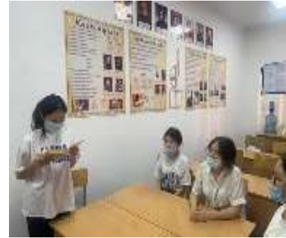
Ж.Аймауытов «Қартқожа» оқу сағаты