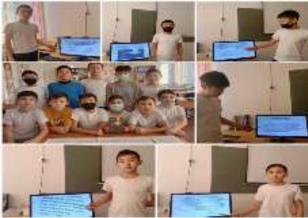
Сәкен Жүнісовтің «Жапандағы жалғыз үй» романын оқып, талдады